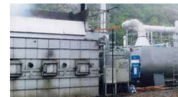
バイオマスボイラー